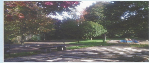
Liesenich Dorfpark mit Spielfeldern und Tretbecken, Ortsausgang in Richtung Beilstein / Mosel.