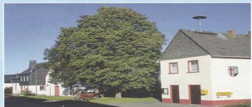
Forst Die Dorfmitte mit Backhaus und Kirche aus dem Jahr 1747.