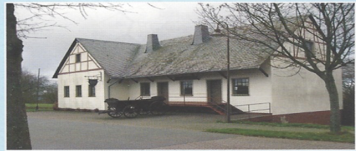
Mittelstrimmig Heimatmuseum Mittelstrimmig. 1979 aus der alten Dorfmuhle entstanden. 1988 großer Erweiterungsbau. Das Museum zeigt Gegenstände des dörflichen Lebens aus längst vergangenen Zeiten.