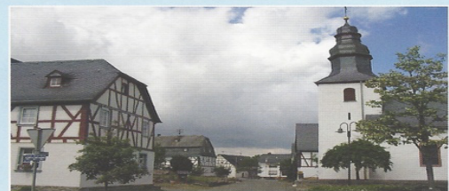
Altstrimmig Blick in die Dorfmitte vom Lindenbäumchen, mit restaurierten und mehrfach ausgezeichneten Fachwerkhäusern. Rechts die Dorfkirche von 1727.

eine. Eines der größten gemeinsamen Projekte bildet die gemeinsam hergestellte 14 km lange Traumschleife „Layensteig“. Die drei Heimat- und Verkehrsvereine Altstrimmig, Liesenich, Mittelstrimmig sowie die Dorfgemeinschaft Forst wünschen allen Wanderfreunden und -freundinnen angenehme und erholsame Stunden auf Schusters Rappen.